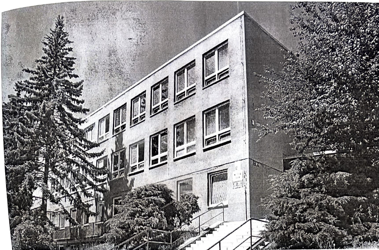
Obr. 1. Budova MŠ Úvoz 424/57, Brno, pohled z východní strany.