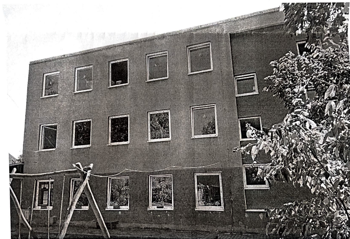
Obr. 2. Budova MŠ Úvoz 424/57, Brno, pohled ze západní strany.